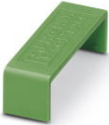
Lock, prevents MSTB plug being pulled out unintentionally, color: l green

Please be informed that the data shown in this PDF Document is generated from our Online Catalog. Please find the complete data in the user's documentation. Our General Terms of Use for Downloads are valid ( http://phoenixcontact.com/download )