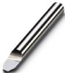
Fully hard metal chisel, 1 cutting edge, cutting width: 0.3 mm

Please be informed that the data shown in this PDF Document is generated from our Online Catalog. Please find the complete data in the user's documentation. Our General Terms of Use for Downloads are valid ( http://phoenixcontact.com/download )