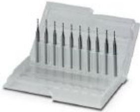
Fully hard metal milling cutter, 2 cutting edges, milling width: 1.0 mm

Please be informed that the data shown in this PDF Document is generated from our Online Catalog. Please find the complete data in the user's documentation. Our General Terms of Use for Downloads are valid ( http://phoenixcontact.com/download )