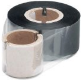
Ink ribbon for WIREMARK, length: 300 m, printing color: Black, width: 24.5 mm

Please be informed that the data shown in this PDF Document is generated from our Online Catalog. Please find the complete data in the user's documentation. Our General Terms of Use for Downloads are valid ( http://phoenixcontact.com/download )