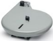
Foil magazine WIREMARK, to accommodate the labeling foil, width: 15 mm

Please be informed that the data shown in this PDF Document is generated from our Online Catalog. Please find the complete data in the user's documentation. Our General Terms of Use for Downloads are valid ( http://phoenixcontact.com/download )