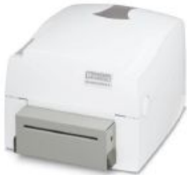
Cutter, for the THERMOMARK S1

Please be informed that the data shown in this PDF Document is generated from our Online Catalog. Please find the complete data in the user's documentation. Our General Terms of Use for Downloads are valid ( http://phoenixcontact.com/download )