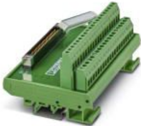
VARIOFACE module for Fujitsu FCN 40

Please be informed that the data shown in this PDF Document is generated from our Online Catalog. Please find the complete data in the user's documentation. Our General Terms of Use for Downloads are valid ( http://phoenixcontact.com/download )