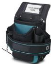
Tool belt pouch, unequipped, business card-sized marking label printed according to customer specifications

Please be informed that the data shown in this PDF Document is generated from our Online Catalog. Please find the complete data in the user's documentation. Our General Terms of Use for Downloads are valid ( http://phoenixcontact.com/download )