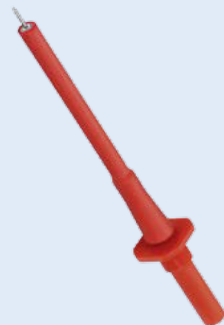
SPS 7097 Ni/..(Farbe) SPS 7097 Ni/..(colour)