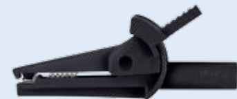
SAK 6715 Ni/2/..(Farbe) SAK 6715 Ni/2/..(colour)