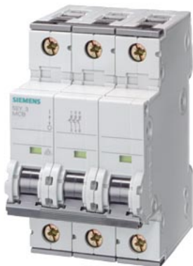
小型断路器 400V 6kA, 3 极, D, 2A