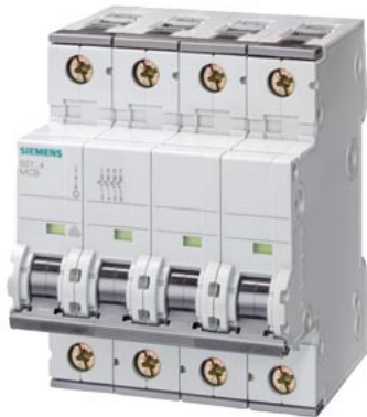
小型断路器 400V 6kA, 4 极, D, 3A