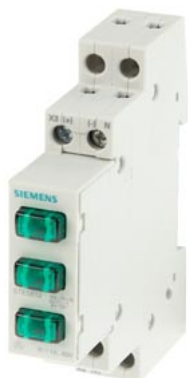
lampka fazowa 3x LED, 230 V 3x zielony