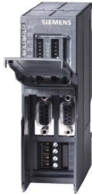
SIMATIC DP, DP/DP coupler Coupling module for connecting of two PROFIBUS DP networks redundant current infeed