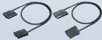
X210-3/X210-3D X210-4/X210-4D X210-3T/X210-3DT X210-4T/X210-4DT