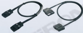
X210-1/X210-1D X210-2/X210-2D X210-1T/X210-1DT X210-2T/X210-2DT