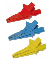
Krokodilklemme 1 kV 20 A rot/ blau / gelb

WAPRZ1X2BLBB WAPRZ1X2REBB WAPRZ1X2BUBB WAPRZ1X2YEBB