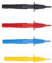
Tastsonde mit Bananenbuchse schwarz / rot/ blau / gelb

WASONBUOGB1 WASONREOGB1 WASONBLOGB1 WASONYEGB1