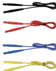
Prüfleitung 1,2 m (Bananenstecker) schwarz / rot/ blau / gelb

WASONBUOGB1 WASONREOGB1 WASONBLOGB1 WASONYEGB1