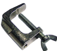
Kl. Schraubstock (Bananenstecker)