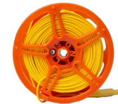
Prüfleitung 50 m auf Spule (Bananensteckern) gelb