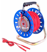
Prüfleitung auf einer Rolle rot 75 m / 100 m / 200 m

WAPRZ075REBBSZ WAPRZ100REBBSZ WAPRZ200REBBSZ