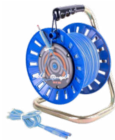
Prüfleitung auf einer Rolle blau 75 m / 100 m / 200 m

WAPRZ075REBBSZ WAPRZ100REBBSZ WAPRZ200REBBSZ