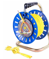
Prüfleitung auf einer Rolle gelb 75 m / 100 m / 200 m

WAPRZ075BUBBSZ WAPRZ100BUBBSZ WAPRZ200BUBBSZ