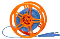
Prüfleitung 15 m auf Spule blau