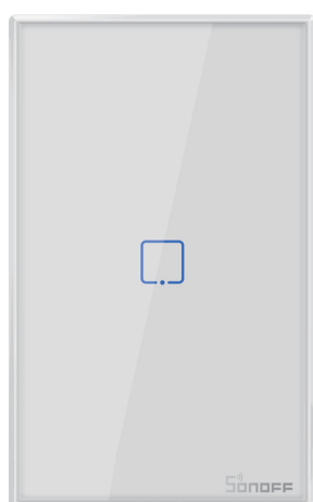
T0, T2 (1C/2C/3C)

Wi-Fi智能墙壁触摸开关(美规)/Wi-Fi Smart Wall Switch US Type