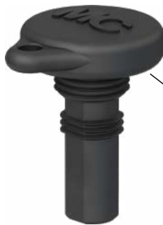
Stecker-Verschlusskappe Sealing cap for male cable coupler

Typ/Type: PV-SVK4 Bestell-Nr./Order No.: 32.0716