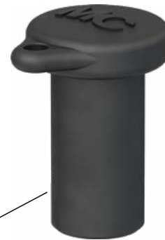
Buchsen-Verschlusskappe Sealing cap for female cable coupler

Typ/Type: PV-SVK4 Bestell-Nr./Order No.: 32.0716