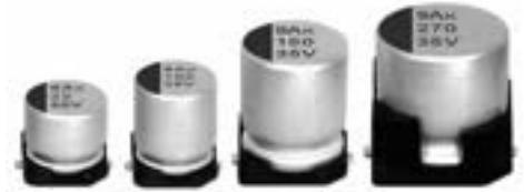
表示色 : ケース頭部に青色印刷