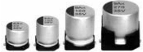
表示色 : ケース頭部に青色印刷