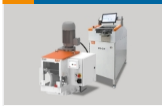
高压线束加工设备(25)