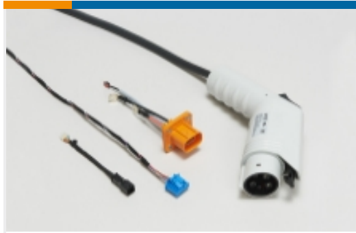
电动、混合动力和燃料电池线束(10)