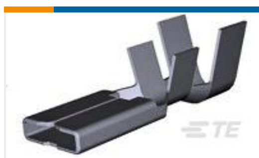
TE 产品编号 1544228-1 CLIP 8 MM NG1-1 G3