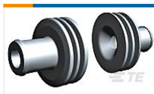
TE 产品编号 1544316-1 JOINT VERT G2