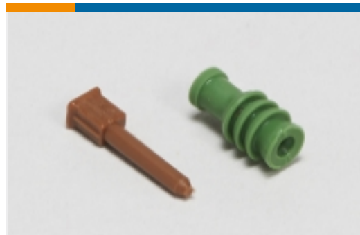
汽车密封件和盲堵(7)