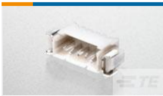
TE 产品编号3-1734261-8 1.25 WTB PLUG RA 30U" 8 POS