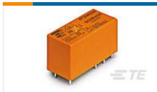
TE 产品编号7-1393239-7 RT314A03