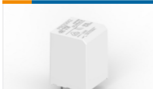
TE 产品编号7-1415539-8 PB133012