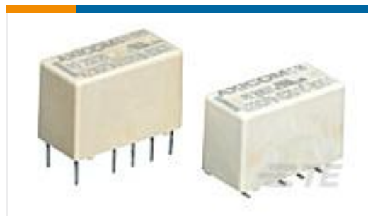
TE 产品编号5-1393788-7 V23079D1003B301