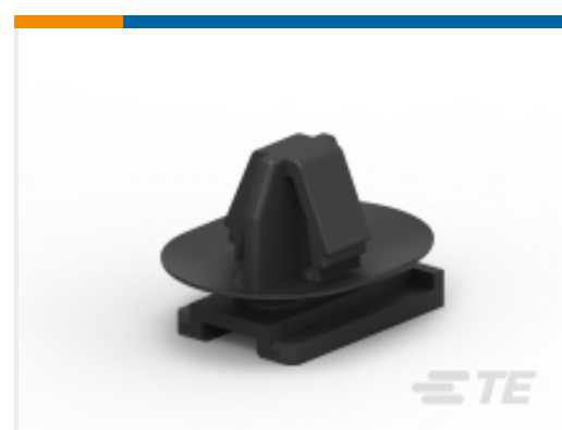
TE 产品编号1-1897255-2 SLOT CLIP FOR J300 / 090 TYPE