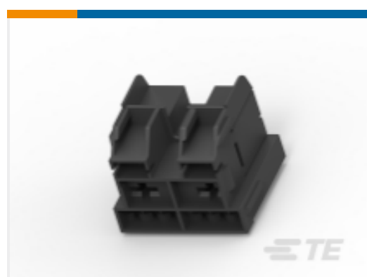
TE 产品编号1380006-1 MINI RELAY SUPPORT