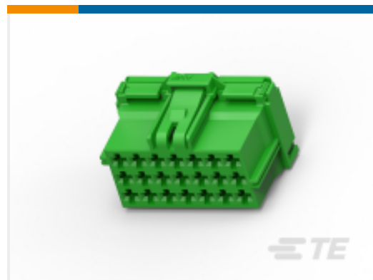
TE 产品编号1897213-2 AMP MCP, 非密封连接器壳体