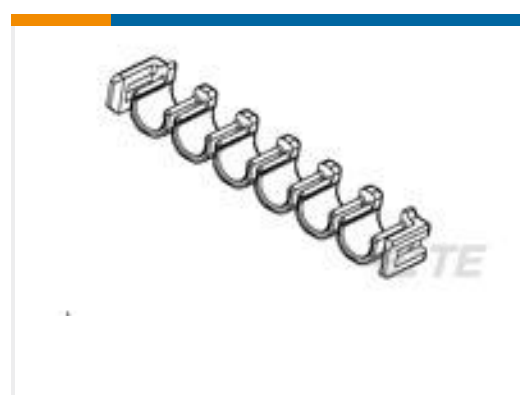
TE 产品编号936397-5 2.8MM SLD 6P PLUG RETAINER YEL