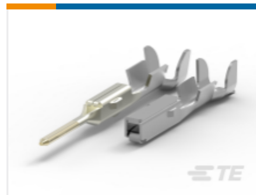
TE 产品编号1743656-1 MULTILOCK, 母端和公端