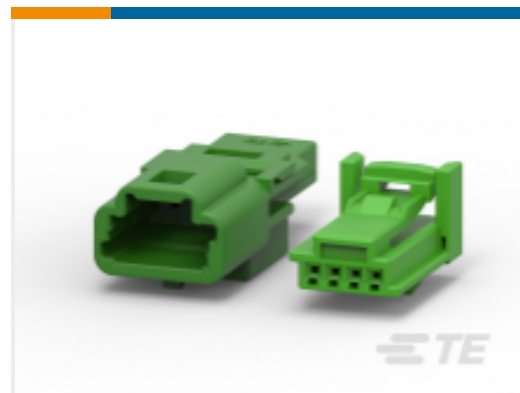
TE 产品编号2109520-1 TH/.025 连接器系统, 壳体