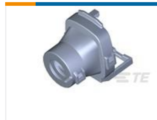
TE 产品编号1-936049-1 COVER HSG FOR E-J PLUG 16P