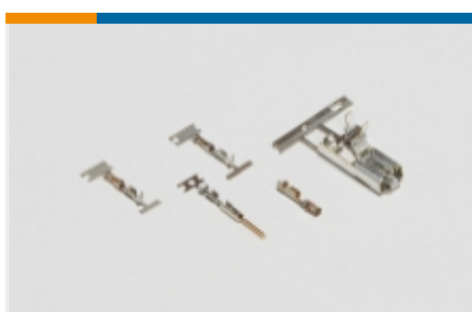
线到板连接器端子(27)