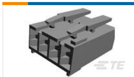
TE 产品编号2-1241959-4 STD TIM HOUSING MKII 4POS