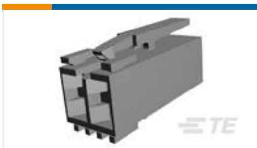
TE 产品编号1241961-1 STD TIM HOUSING MKII 2POS