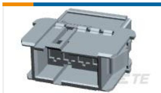
TE 产品编号9-927742-4 4POS FASTIN FASTON HOUSING