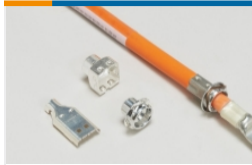
汽车连接器 EMC 屏蔽(1)