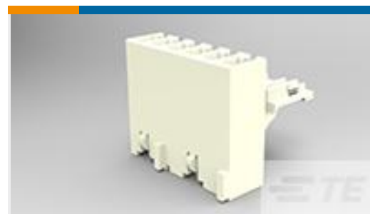
TE 产品编号1-1241964-1 11POS STANDARD TIMER HOUSING