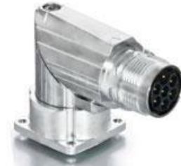
Contact Arrangement mating view

B ED C 854 NN 00 00 052A 000 B G C 854 N 00 00 052A 000