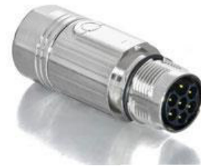
Contact Arrangement mating view