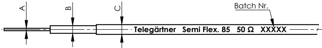
marking / Kennzeichnung

Packaging unit: 25 m ± 0,5 m, as cable ring, tied. (f) Verpackungseinheit: 25 m ± 0,5 m, als Ring gebunden.