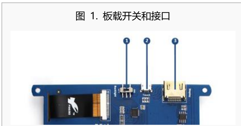
图 1. 板载开关和接口