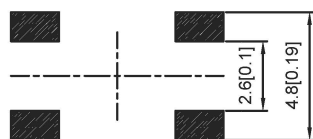
PCB Layout(pattern side)