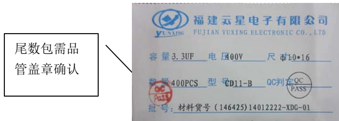
零数标签 (标签尺寸: mm)

备注：装有零数产品的包装必需有品管确认并盖 QC 确认章 同时将合并尾数生产批号登记留底追溯