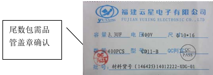
零数标签（标签尺寸： mm）

备注：装有零数产品的包装必需有品管确认并盖 QC 确认章 同时将合并尾数生产批号登记留底追溯